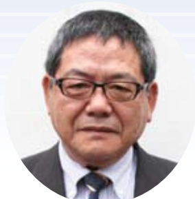
①福江 帳留 ②公共関係 (刈払・除草除く)