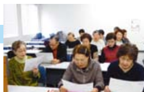
仲良しカラオケクラブ