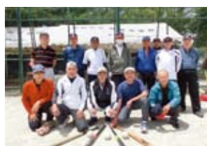
早良ソフトボールエラーズ