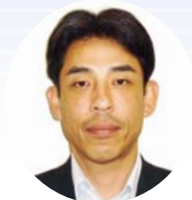
①石堂 高大 ② 連合福岡・ 福岡地域協議会