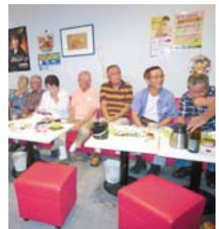
カラオケ同好会 (みちくさ)